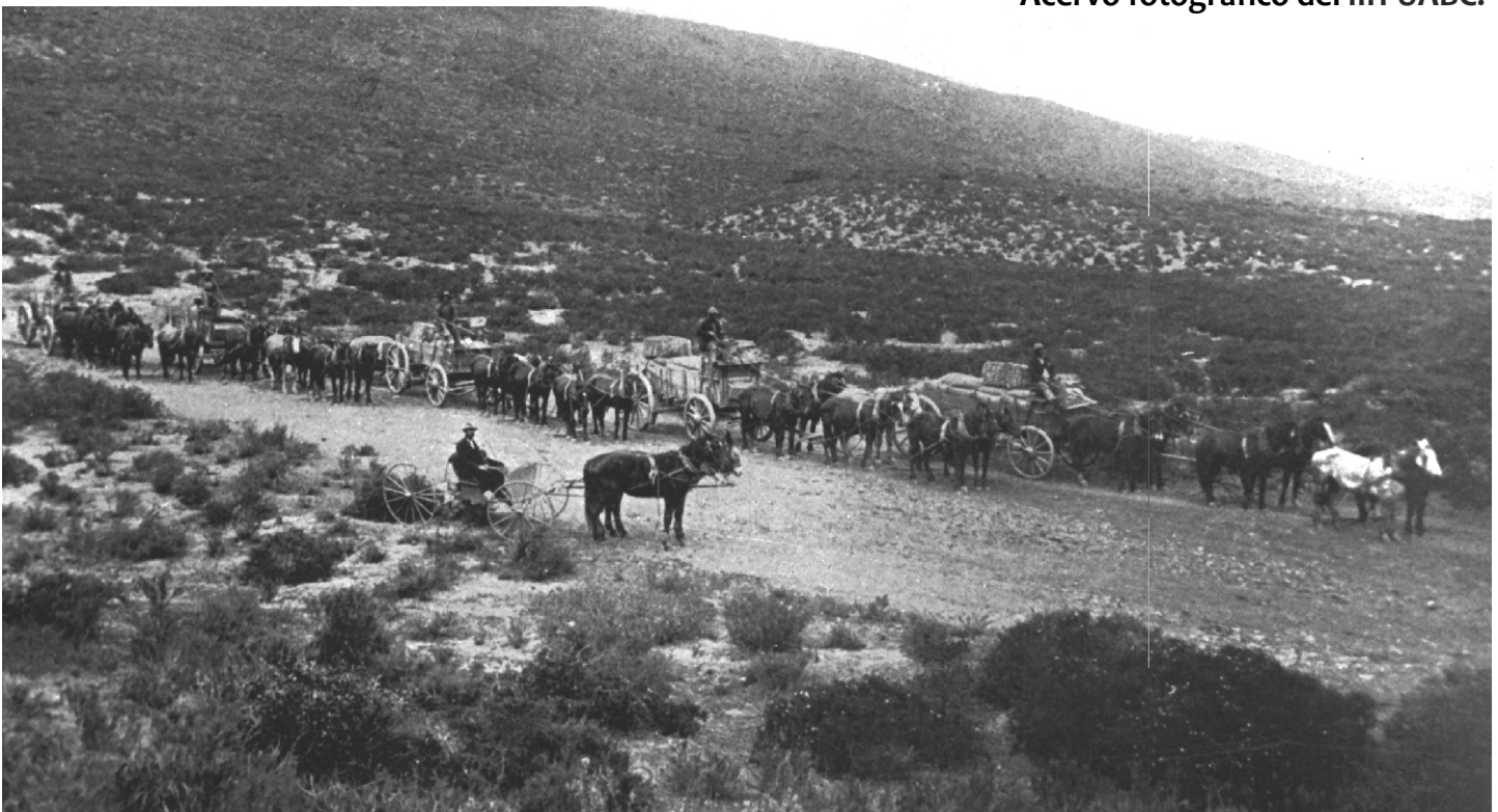
Carretas con mercancías con destino al Puerto de Todos Santos, Circa 1898.